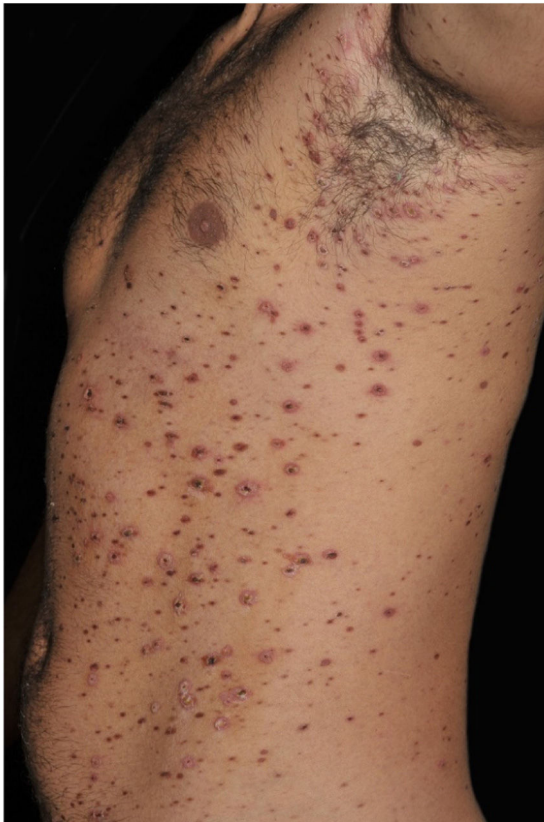
Figura 2 PLEVA: lesões papulonecróticas e pápulas recobertas por crostas hemáticas. Durante o tratamento com metotrexato e corticosteroide sistêmico.