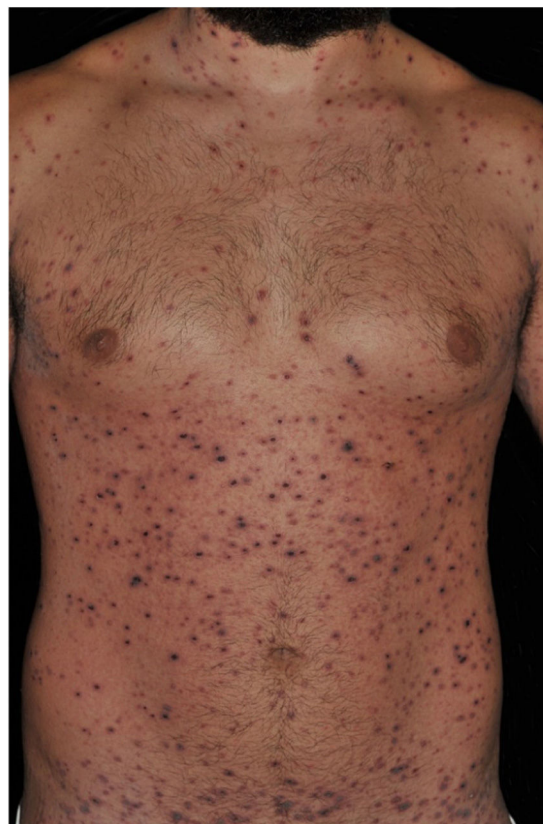
Figura 1 PLEVA: inúmeras vesículas de conteúdo hemorrágico e pápulas recobertas por crostas hemáticas. Pré-tratamento.

☆☆ Trabalho realizado no Departamento de Dermatologia e Radio-terapia, Faculdade de Medicina de Botucatu, Universidade Estadual Paulista, Botucatu, SP, Brasil.