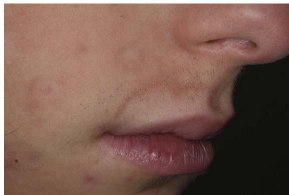
Figura 1 Manchas acrômicas circundadas por halo eritematoso e poliose em pelos de barba em regiões malar e perioral direita.

O mecanismo de ação da isotretinoína nessa suposta associação ainda não está completamente elucidado, mas a droga parece ter um papel no desencadeamento da autoimunidade em indivíduos geneticamente susceptíveis. 5 Têm sido descritos vários relatos de surgimento de doenças autoi-