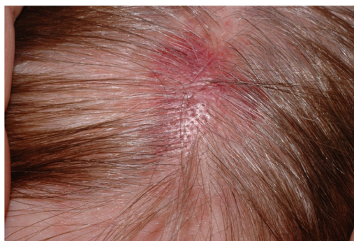
Figura 1 Placa eritematosa com início recente na cabeça de uma mulher de 60 anos.

Devido à reativação do VVZ, presente em estado latente nos gânglios sensoriais, o HZ pode permanecer inativo por