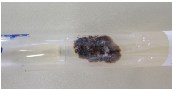
Figura 3 Cultura de fungos a 25°C apresenta colônia filamentosa enegrecida com áreas esbranquiçadas. Colônia com crescimento em sete dias.

posterior e associado à infecção fúngica, sem outra causa evidente.