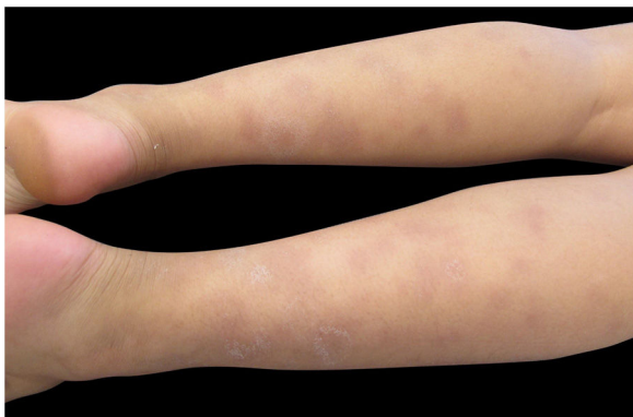
Figura 2 Dermatose localizada nos membros inferiores, caracterizada por nódulos eritematosos e violáceos de diversos tamanhos, mais palpáveis do que visíveis.