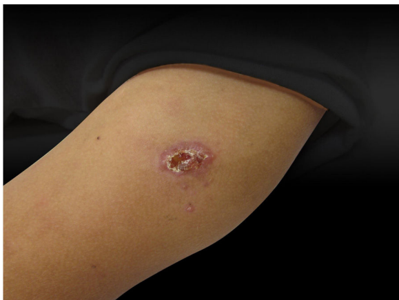
Figura 1 Dermatose localizada na porção superior do braço esquerdo, caracterizada por úlcera de bordas eritematosas com limites bem definidos e fundo granuloso que medeia aproximadamente 1,5 cm de diâmetro.