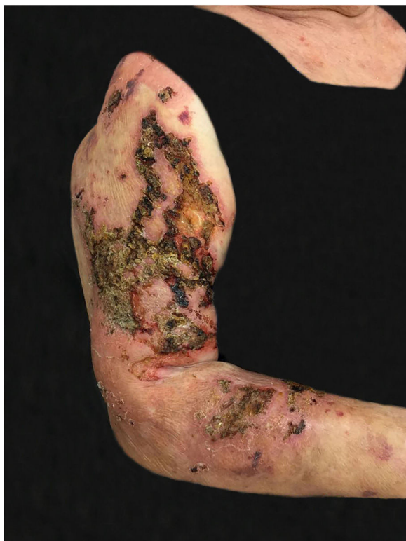
Figura 1 Paracoccidioidomicose: lesões ulceronecroticas, fagedênicas, com áreas recobertas por crostas, acometem braço e antebraço direito.