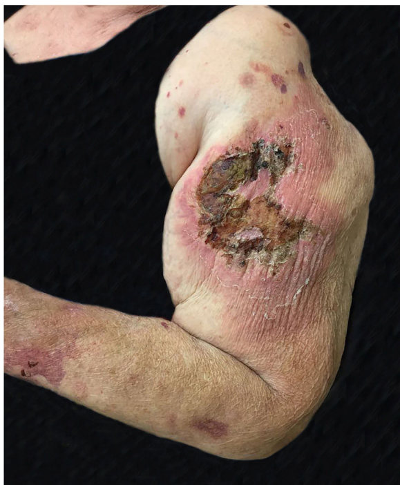
Figura 2 Paracoccidioidomicose: lesão ulceronecrotica extensa, áreas recobertas por crostas e com halo inflamatorio intenso. Pápulas e placas satélites. Localizadas no braço e antebraço esquerdo.