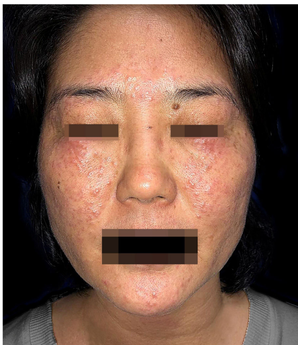
Figura 1 Pápulas eritematosas em malaras, regiões frontal e mentoniana. Placas formadas por coalescência de pápulas em região palpebral bilateral.