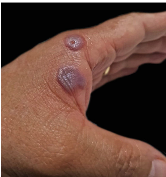
Figura 4 As bolhas da Paciente 2 após uma semana, com perda de tensão, mas mantinham o conteúdo hemorrágico.