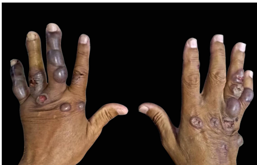
Figura 2 Bolhas de conteúdo hemorrágico nas mãos do Paciente 1, que relatou picadas de inseto mas não os identificou. Notar a extensão das lesões.

Indivíduo de 70 anos, pescador aposentado, procedente de São Sebastião (SP). Apresentava hipertensão arterial, em uso de losartana, hidroclorotiazida e anlodipino. Referiu aparecimento de bolha em mão havia 15 dias após picada de inseto que não viu, negou uso de qualquer substância ou medicação no local. Procurou Unidade de Pronto Atendimento; recebeu prescrição de antialérgico ( sic ) e penicilina benzatina, mas com surgimento de novas lesões bolhosas de conteúdo hemorrágico (fig. 2). Negou dor, prurido ou qualquer outra manifestação associada. Em nova consulta, foi avaliado por um dermatologista, que orientou o esvaziamento das bolhas, prednisona, ciprofloxacina, sulfadiazina, sabonete antisséptico, sem melhoria. As lesões desapareceram após 15 dias.