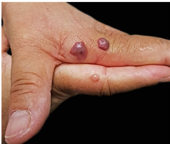
Figura 3 Bolhas nas mãos da Paciente 2, que identificou as picadas como de mutucas. Algumas têm conteúdo hemorrágico e um ponto central onde ocorreu a picada.