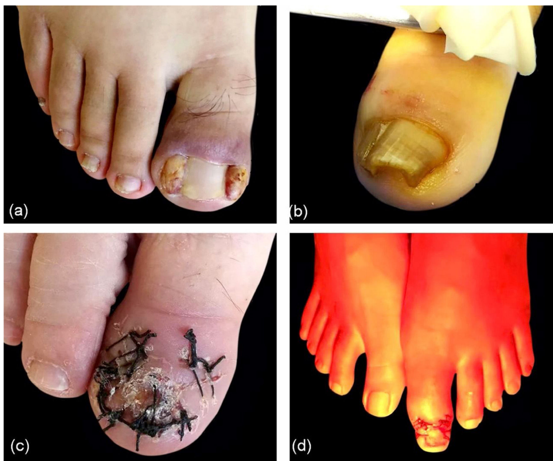
Figura 4 Pontos chave. A, Grandes massas nas regiões triangulares. B, Placa ungueal espessa. C, Remoção de toda a placa ungueal antes da cirurgia. D, Tratamento com radiação infravermelha-A filtrada por água (wIRA).