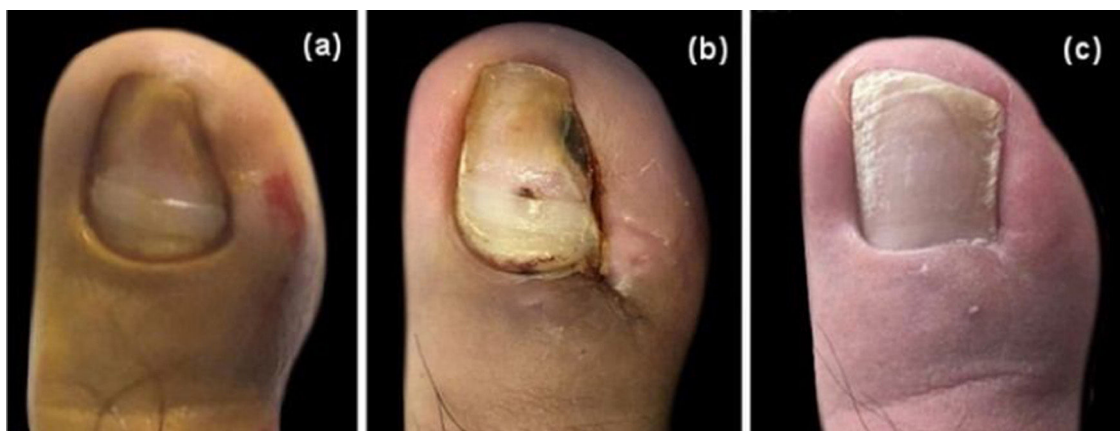
Figura 3 Resultado cosmético. A, Imagem pré-operatória. B, Após remoção dos pontos no 14º dia. C, Seguimento de um ano.

O processo de cicatrização durou de três a quatro semanas aproximadamente, e as suturas foram retiradas no 14º dia do pós-operatório (fig. 2). Dos 67 pacientes, 15 receberam o tratamento em unhas dos dois pés. Quase todos os pacientes sentiram dor pós-cirúrgica, mas apenas cinco precisaram tomar anti-inflamatórios não esteroides (AINEs) para aliviar a dor. Todos os casos receberam tratamento com radiação infravermelha-A filtrada por água (wIRA – do inglês water-filtered infrared-A ), e apenas três casos graves contraíram infecção local e receberam antibióticos. A aparência da unha foi quase inalterada, e nenhum paciente se queixou dos resultados cosméticos (fig. 3).