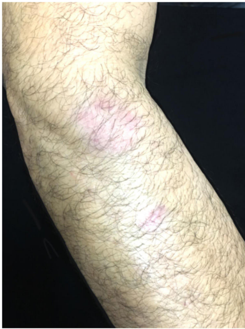
Figura 4 Aspecto clínico das lesões 30 dias após tratamento.

desnecessários e onerosos, que muitas vezes prolongam o sofrimento dos pacientes.