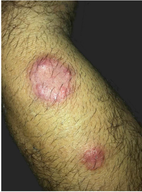
Figura 1 Aspecto clínico das lesões: placa eritematosa de aspecto numular, com pústulas periféricas e pelos tonsurados, localizada no antebraço direito, associada à lesão satélite com as mesmas características. Tinea corporis por Nannizzia gypsea : atraso no diagnóstico por apresentação incomum.

lência se deva à reação inflamatória exuberante por ser este um fungo geofílico, não adaptado ao parasitismo humano. 3,4 Em geral, a clínica da tinea corporis é bastante característica, com reação inflamatória discreta ou moderada, por vezes vesiculosa ou vesico-crostosa, na borda de lesão macular, eritematoescamosa. 5 Neste caso, a apresentação clínica da lesão não era a típica da dermatofitose do corpo; ao