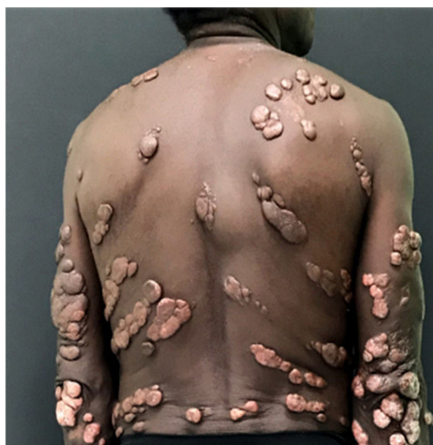
Figura 2 Múltiplos nódulos queilodianos e placas verrucosas disseminados no tegumento.

anatomopatológico foi compatível com CEC metastático para um dentre 13 linfonodos examinados, com extravasamento capsular. Hemograma e sorologias para vírus das hepatites B e C e HIV foram negativas; tomografias compu-