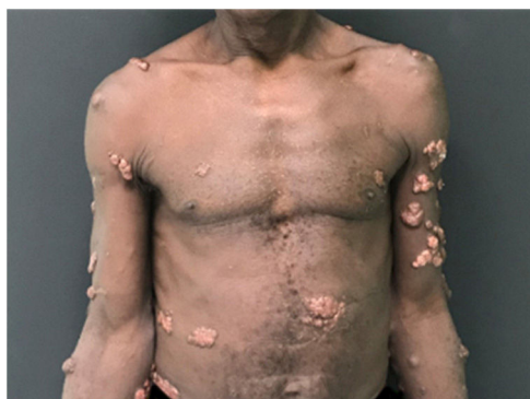
Figura 1 Múltiplos nódulos queilodianos disseminados no tegumento.