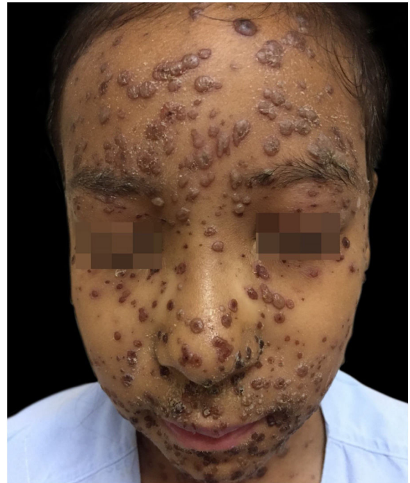
Figura 3 Sétimo dia de aciclovir endovenoso. Bolhas em regressão e crostas.