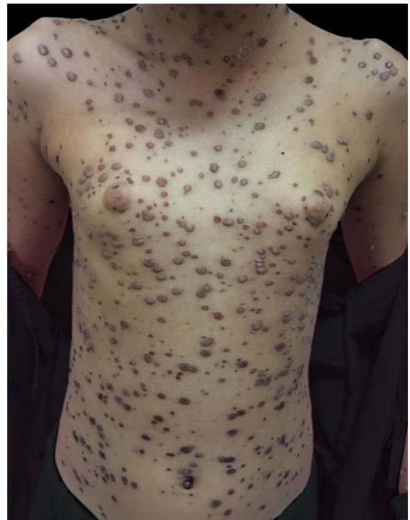
Figura 4 Sétimo dia de internação hospitalar. Bolhas em regressão e crostas.

tanto, a atualização do cartão vacinal não faz parte da rotina para início do metotrexato.