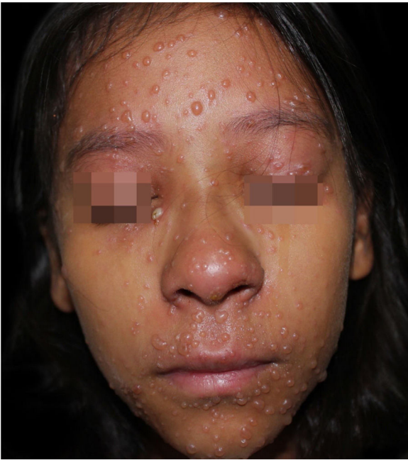
Figura 1 Momento de admissão hospitalar, quinto dia de evolução da doença. Vesículas e bolhas em face; pústula em pálpebra inferior direita.