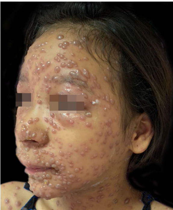
Figura 2 Sétimo dia de evolução. Bolhas com base eritematosa.