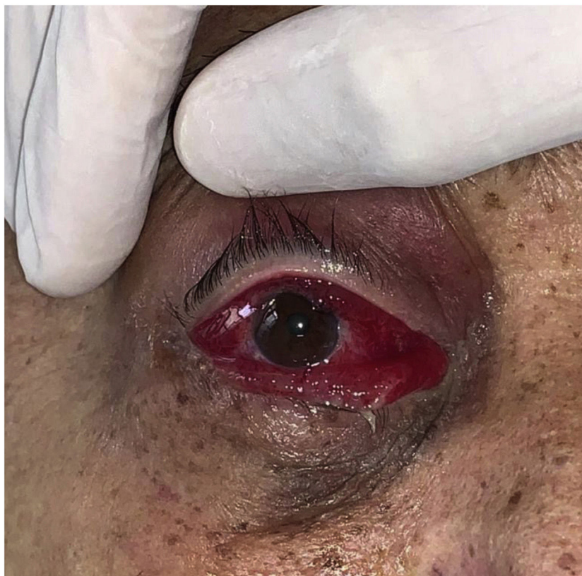
Figura 1 Eritema e edema intenso na conjuntiva, associado a eritema na pálpebra superior. Mucormicose rino-órbito-cerebral.