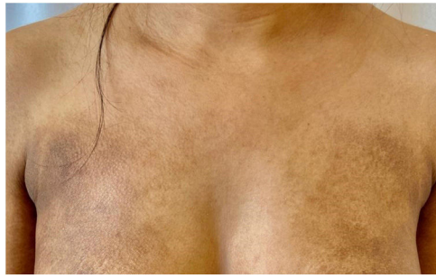
Figura 2 Placas hipercrômicas com descamação ictiosiforme no tronco anterior.