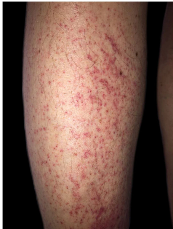
Figura 2 Púrpuras de localização perifolicular.