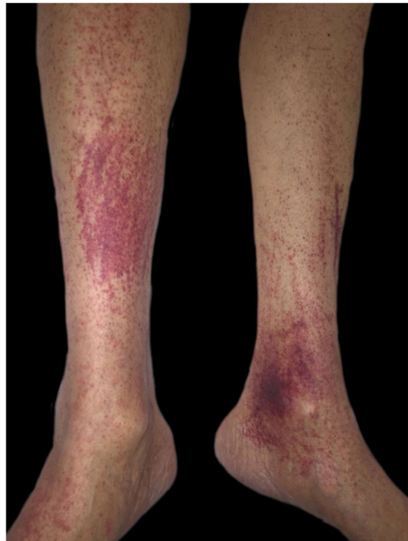
Figura 1 Áreas purpúricas nos membros inferiores.

A causa do escorbuto é a deficiência de ácido ascórbico (vitamina C), encontrado em frutas e vegetais frescos. 2,3 Períodos históricos de maior importância foram “a grande fome irlandesa da batata”, entre 1845 e 1849, quando a população da Irlanda se reduziu em 20% a 25%, a “guerra civil americana” e, mais recentemente, a “guerra do Afeganistão”, em 2002. Apesar de incomum e lembrado por seus aspectos históricos, o escorbuto não é uma doença erradicada – ela ainda é encontrada, em especial em indivíduos com dietas estranhas, idosos, alcoolistas, portadores de neoplasias ou distúrbios de absorção intestinal e pacientes em hemodiálise. Os rins reabsorvem a vitamina C e a excretam na urina apenas quando ultrapassa o nível sérico, porém na