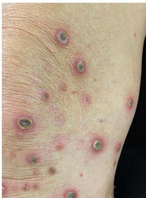
Figura 2 Úlceras crateriformes com tampão ceratósico central.

predominantemente nas superfícies extensoras dos membros, glúteos e tronco. O acometimento das mucosas só é observado na forma hereditária da colagenose reativa perforante. 3,4