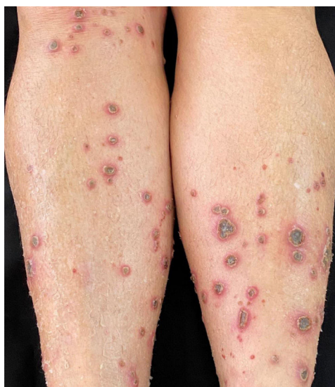
Figura 1 Múltiplas pápulas eritematosas e úlceras crateriformes nos membros inferiores associadas à xerose.

Com base nos aspectos clínicos e histopatológicos, estabeleceu-se o diagnóstico de colagenose reativa perforante adquirida (CRPA) desencadeada pela escoriação de lesões pruriginosas. Nas duas maiores séries de casos de DPA até agora publicadas, a CRPA foi a forma mais comum. 3,4 O aspecto clínico é bem característico: pápulas, placas ou nódulos eritematosos ou acastanhados, que rapidamente se tornam umbilicados e evoluem com ulceração crateriforme recoberta por um tampão ceratósico. Surgem