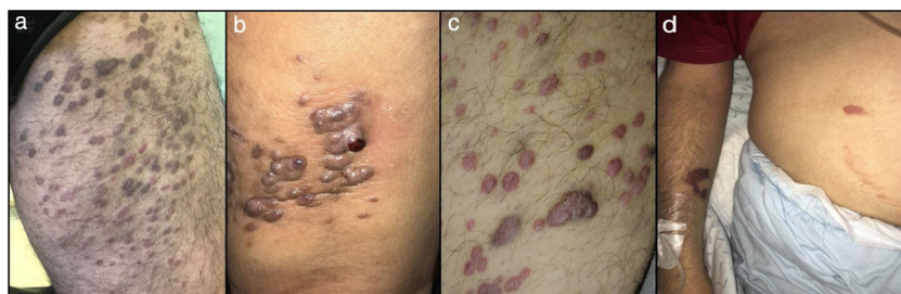
Figura 1 Apresentação clínica do sarcoma de Kaposi em quatro pacientes. (A-C), lesões papulonodulares violáceas nas extremidades inferiores (a apresentação clínica mais comum); (D), pequeno número de manchas violáceas no membro superior e abdome em paciente com HIV.