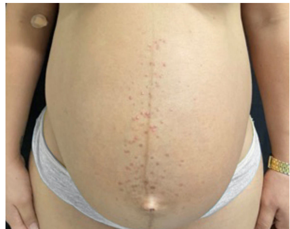
Figura 1 Pápulas eritematosas e pústulas localizadas no esterno e no abdome (linha nigra ).

Paciente do sexo feminino, 26 anos, primigesta, no curso de 31 semanas de gestação, relatava aparecimento de lesões cutâneas pruriginosas no tronco, com dois meses de evolução. Ao exame físico, observavam-se pápulas eritematosas e pústulas localizadas no abdome (em especial na linha nigra ), no esterno, dorso e na face lateral dos glúteos (figs. 1 e 2). Foram solicitados exames laboratoriais e realizada biópsia de pústula do dorso. Os exames laboratoriais não revelaram anormalidades, e a análise histopatológica evidenciou infiltrado perivascular predominantemente linfocítico na derme, além de folículo piloso permeado por infiltrado inflamatório com predomínio de