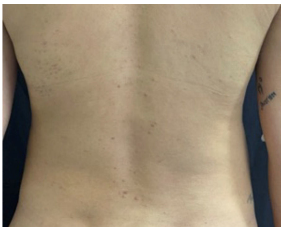
Figura 2 Pápulas eritematosas localizadas no dorso.