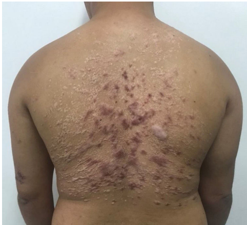
Figura 5 Manutenção apenas de lesões cicatriciais, três meses após concluir o tratamento com miltefosina.

nea, mucosa, disseminada ou cutânea anérgica difusa, com apresentações clínicas bastante variáveis, podendo gerar lesões desfigurantes e deformidades definitivas. 1,2 A leishmaniose disseminada é caracterizada por polimorfismo de lesões, que podem ser pápulas acneiformes, nódulos ou úlceras, com no mínimo dez lesões em pelo menos dois segmentos corporais não contíguos, e há acometimento mucoso na maioria dos casos. 2 Essas lesões disseminadas, em geral, surgem duas a seis semanas após a lesão ulcerada inicial; é frequente a associação com febre, calafrios, astenia e náuseas. 2 Os principais diagnósticos diferenciais são a leishmaniose cutânea anérgica difusa, em que as lesões são mais infiltradas e sem ulcerações ou acometimento mucoso, e a leishmaniose cutânea com múltiplas lesões em pacientes imunossuprimidos. 2