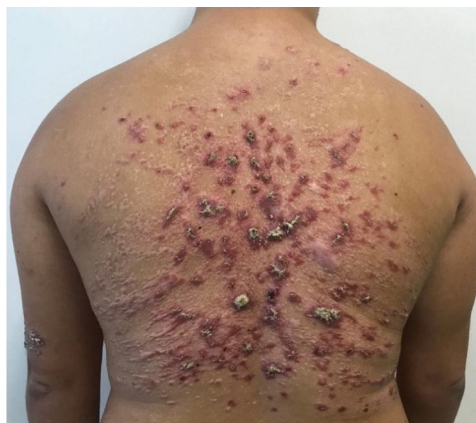
Figura 3 Predomínio de lesões cicatriciais após o tratamento com anfotericina B lipossomal, porém ainda mantendo algumas lesões ativas (dose total acumulada 3 g).

Após dois meses do segundo tratamento, o paciente evoluiu com recidiva parcial. Na tentativa de evitar outra internação prolongada com múltiplas morbidades, optou-se pelo tratamento com miltefosina 50 mg de 8/8 horas por 38