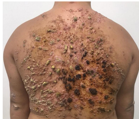
Figura 1 Pápulas coalescentes formando extensa placa verrucosa no dorso, observada na primeira consulta.

Paciente do sexo masculino, 28 anos, portador de síndrome de Down, com relato de aparecimento de lesões no dorso havia um ano e três meses, com aumento progressivo (fig. 1). Não havia prurido, dor ou sintomas sistêmicos associados. O paciente referiu tratamento prévio com itraconazol e ter-