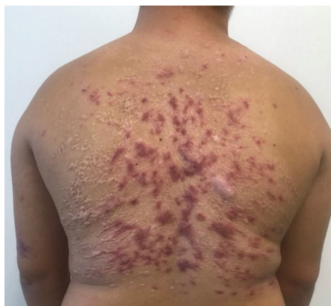
Figura 4 Resposta satisfatória imediatamente após o tratamento com miltefosina.

dias, com boa resposta e tolerabilidade (fig. 4). O paciente manteve boa resposta no acompanhamento três meses após a medicação, permanecendo apenas com lesões cicatriciais (fig. 5).