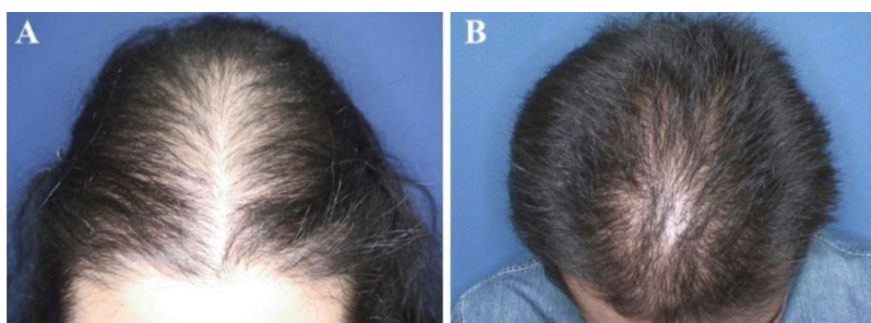
Figura 2 Padrões de queda de cabelos observados na alopecia androgenética pediátrica. (A), Padrão em “árvore de Natal” em uma paciente do sexo feminino com alopecia androgenética na adolescência. (B), Recessão bitemporal, frontoparietal e no vértice em um paciente do sexo masculino com alopecia androgenética na adolescência.

resultados do hemograma completo, níveis sanguíneos de ferritina, hormônio estimulador da tireoide e DHEAS estavam dentro dos níveis normais.