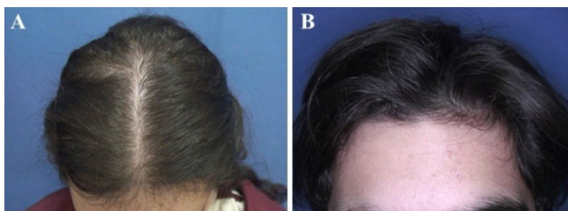
Figura 1 Padrões de queda de cabelos observados na alopecia androgenética pediátrica. (A), Afimamento difuso na região da coroa com preservação da linha frontal capilar em uma paciente do sexo feminino com alopecia androgenética na adolescência. (B), Preservação da linha frontal capilar em um paciente do sexo masculino com alopecia androgenética na adolescência apresentando afinamento difuso na região da coroa.