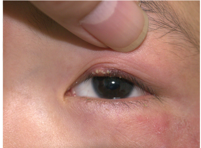
Figura 1 Apresentação clínica: eritema com descamação discreta na pele periorcular e papulopústulas leitosas do tamanho de sementes de gergelim na pálpebra superior esquerda.

A dermatofitose é infecção fúngica superficial comum, geralmente causada por Trichophyton rubrum . Pés, tronco e unhas são os locais mais afetados. As características de uma lesão típica consistem em uma clareira central, cercada por borda elevada progressiva, eritematosa, descamativa e com vesículas, que também podem aparecer na borda da área afetada com o aumento da inflamação. 1 A blefarite é doença inflamatória crônica das pálpebras, com sintomas complexos, geralmente causada por colonização bacteriana e ácaros Demodex . 2 No entanto, alguns dos