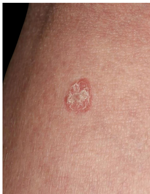
Figura 2 Detalhe da lesão mostrando lesão eritematosa circunscrita, levemente elevada, com escamas.