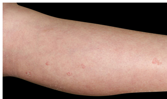
Figura 1 Múltiplas lesões ceratóticas eritematosas na extremidade inferior direita.

A poroceratose eruptiva é caracterizada pelo rápido início da poroceratose, que ocasionalmente se apresenta com mais de 100 lesões afetando várias regiões, em associação com condições paraneoplásicas, imunossupressoras, inflamatórias e outras. 1 Sabe-se que a poroceratose se desenvolve em associação com imunossupressão sistêmica ou sob terapias imunossupressoras; entretanto, ainda não está claro como a imunossupressão induz o desenvolvimento de poroceratose. 2 Um possível mecanismo é que a imunossupressão induza uma população alterada de ceratinócitos epidérmicos direta ou indiretamente. 2 O clone anormal de ceratinócitos prolifera de maneira desordenada e altera o crescimento normal da epiderme. 3 Pacientes com insuficiên-