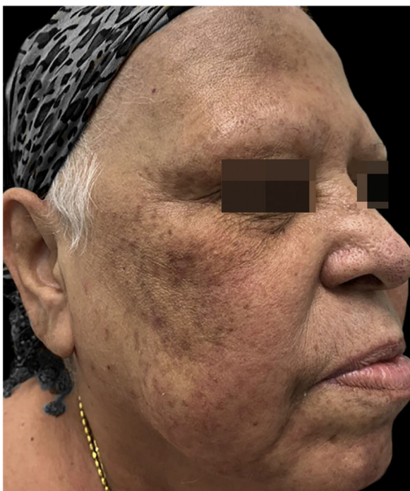
Figura 3 Hiperchromia pós-inflamatória sem presença de lesões pustulosas.