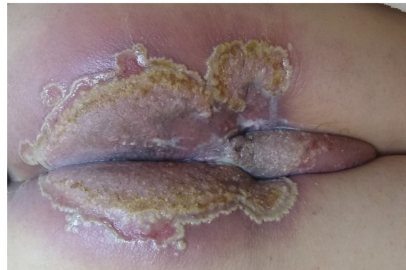
Figura 1 Aspecto clínico inicial, com erosão perianal e interglútea com bordas pustulosas circinadas e algumas pústulas isoladas.

Paciente do sexo masculino, 73 anos de idade, desenvolveu lesão vegetante no canal anal há nove meses, cujo laudo histológico foi de carcinoma epidermoide pouco diferenciado não queratinizante. Foi tratado com dois ciclos de 5-fluoracil e cisplatina e radioterapia concomitante (com acelerador linear 6MV de fótons, dose total de 54 Gy), com remissão completa. Colonoscopia e endoscopia de controle após seis meses do tratamento foram normais. Há 45 dias, apresentou erosão dolorosa perianal e interglútea com bordas pustulosas circinadas e algumas pústulas isoladas, acompanhadas de eritema (fig. 1). Foi internado recebendo antibiótico (ceftriaxone e clindamicina) e fanciclovir sistêmicos. Tomografia computadorizada na internação descartou recidiva tumoral, mostrando canal anal normal. Foi realizada biópsia incisio-