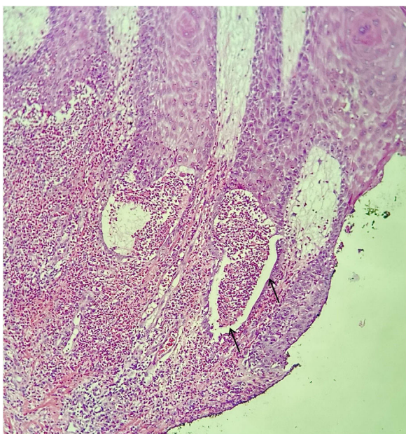
Figura 2 Microscopia óptica com fenda e microabscesso de polimorfonucleares (setas) (Hematoxilina & eosina, 150 ×).