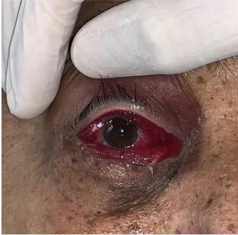
Figura 1 Eritema e edema intenso na conjuntiva, associado a eritema na pálpebra superior. Mucormicose rino-órbito-cerebral.