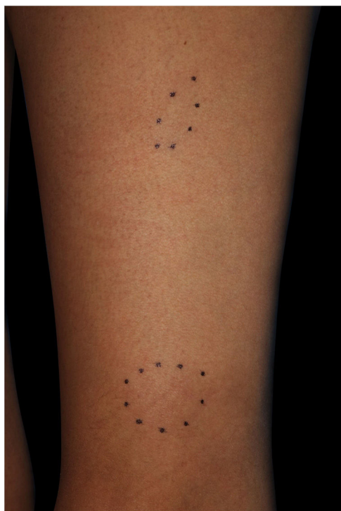
Figura 1 Nódulos subcutâneos na coxa esquerda.

nádegas e antebraço direito (fig. 1). Não havia linfadenopatia palpável. A biópsia de uma das indurações subcutâneas evidenciou a presença de granulomas não caseosos de células epitelioides afetando os tecidos subcutâneos (fig. 2). A radiografia de tórax mostrou linfadenopatia hilar bilateral, e a tomografia computadorizada revelou linfadenopatia mediastinal. O exame laboratorial mostrou função hepática e renal normais, bem como níveis elevados de enzima